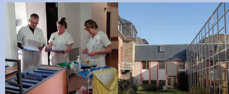
ZESTE Communication - Avril 2010 - Photos © Valérie Couteron

Bus Illeneo : ligne 7A : Arrêt rue de la Gare ligne 16 : Arrêt rue de la Gare