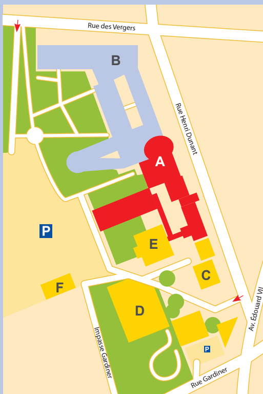
Plan du site